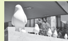
▲この「かげもしゃ」実はいるなところっています

柏の葉の街にはいくつものアート作品がちりばめられています。公園周りや駅周辺を散策しながら「こんなところにもある！」という発見を楽しんでみてはいかがでしょうか。