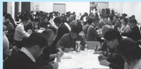
▲顔の見える関係会議の様子

医療・介護職をはじめとするさまざまな職種のかたが、ワークショップ等を通じ直接的な関係づくりを行う「顔の見える関係会議」という取り組みがあります。多職種のかたがつながることで連携体制を構築し、効果的な医療・介護サービスの提供を目指すもので、平成24年から実施しています。毎回、真剣な議論が交わされていて、平成29年度末までに計23回、延べ4,700人を超えるかたが参加しています。