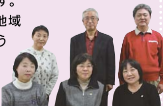
柏市民児協三役のみなさん

地域の皆様が住み慣れた地域で安心して生活できるような地域社会づくりを目指し、日々活動しています。