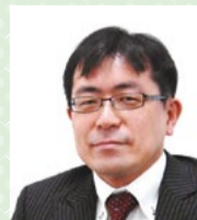
東京大学高齢社会総合研究機構 准教授 (医学博士)

加齢に伴い進む「虚弱 (フレイル)」を予防したいですが、それには筋力低下など身体的な虚弱だけではなく、社会性の虚弱やこころの虚弱も大きく影響します。高齢になるにつれ若い時よりも意欲が低下し、おっくうになり、社会と接することも少なくなりがちです。ときにはうつ傾向に陥り、家に閉じこもって誰とも話をせずに暮らす高齢者も少なくありません。フレイル予防のポイントは「運動」「栄養」「社会参加」の三位一体です。近くの介護予防教室だけではなく、地域には老人会や趣味の会、働く場やボランティア活動など、色々と集う場もあります。そうした場に意識的に参加することも重要なフレイル対策になります。是非、外へ出て頑張りましょう!