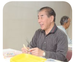
使用済み切手収集のボランティア