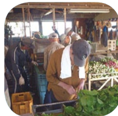
カブの出荷作業中