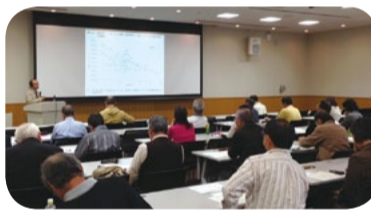
セカンドライフ応援セミナー