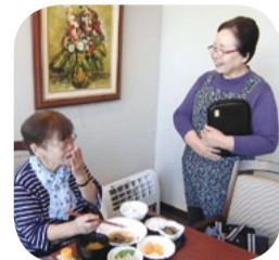
ティーサロンでの接客