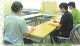
■リハビリ会議風景

リハビリを効果的に行うため、定期的に利用者の方と一緒に多職種が計画の検証を行い、改善を図る会議です。