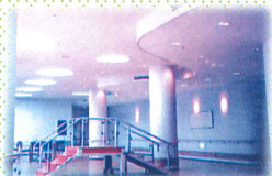
■リハビリコーナー