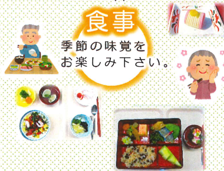
注) 写真は行事食です